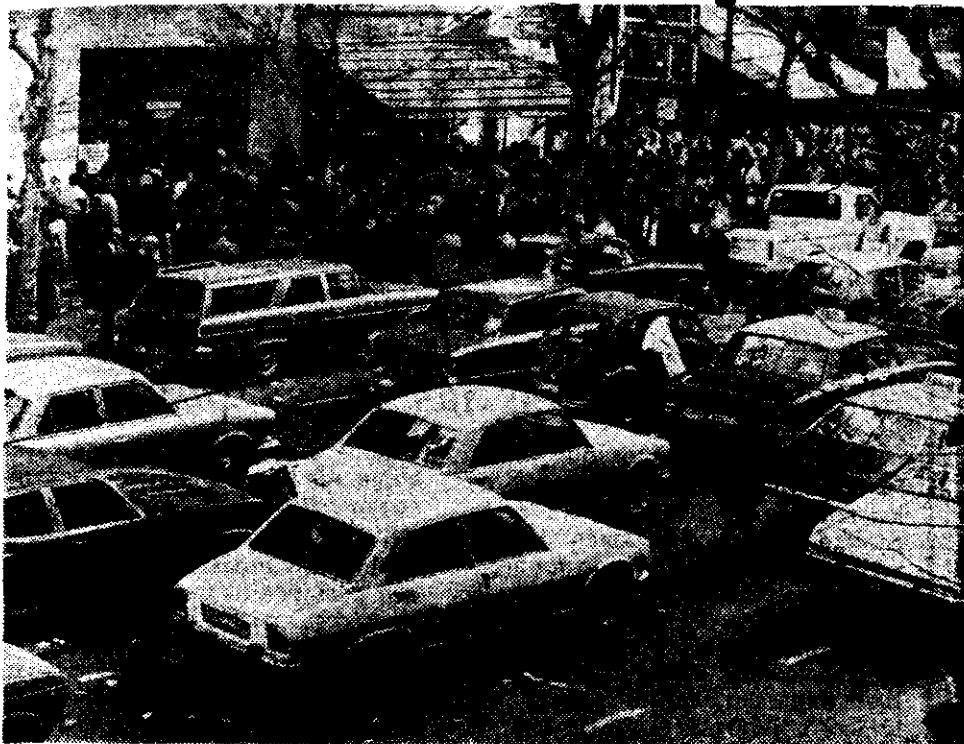
Una larga hilera de familiares de desaparecidos se formó en la jornada de ayer ante la OEA para formular denuncias.

En tanto se observaba una discreta vigilancia policial compuesta por patrulleros que recorrían las inmediaciones y agentes de civil, a pie, que seguían la situación desde la calle. Al mismo tiempo, jóve-