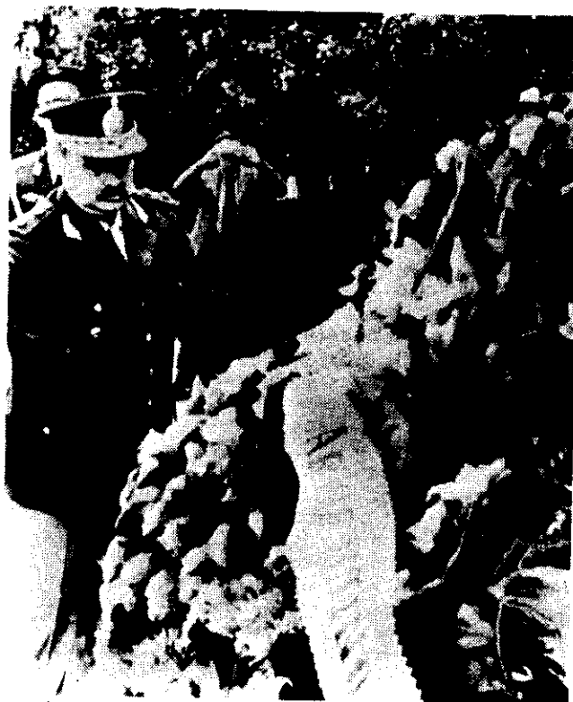
• Argentina's divisional general José Montes places a wreath at the tomb of the Soviet Army's unknown soldier during his visit to Moscow last week.

part of manufacturing industry to shift further away from the thickly populated and badly served Greater Buenos Aires splurge was generally approved in theory but many difficulties were seen in putting it into practice. His move to replace many of the area's military mayors with civilians was interpreted as the first step in the road back to "normalization" through civilian participation at the municipal level. The