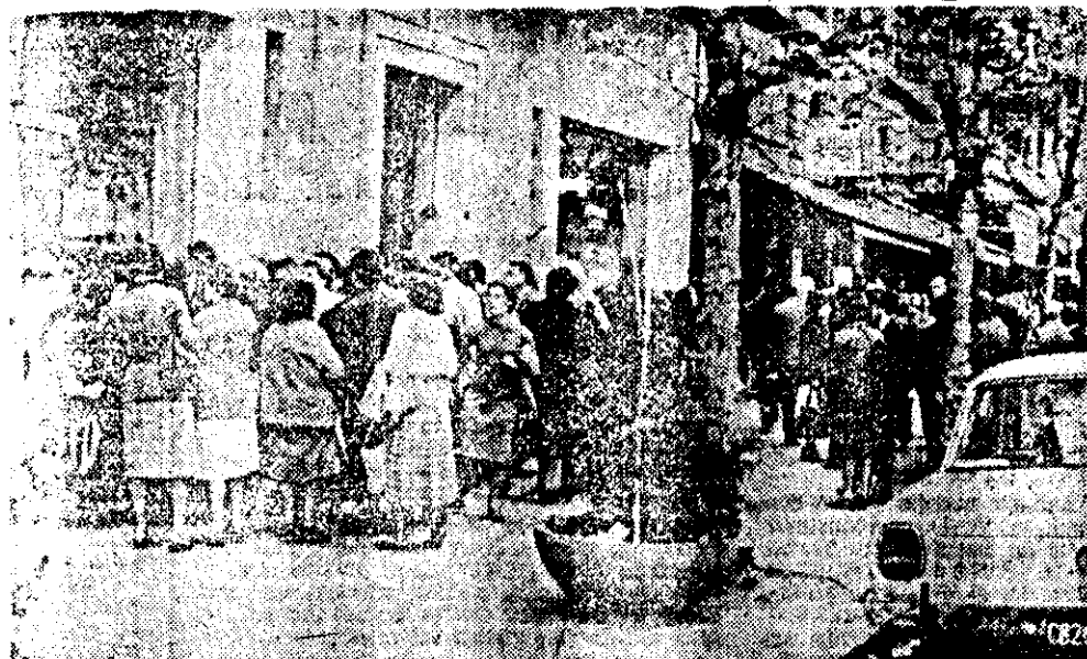
MAS DENUNCIAS. Numerosos familiares de ciudadanos desaparecidos concurren esta mañana al local de la OEA en la Av. de Mayo. Cumplieron tramites.