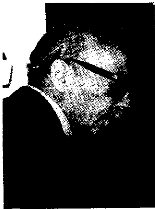
• Ernesto Sábato