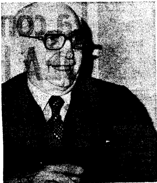
Arturo Frondizi, ex presidente de la Nación.

Sábato comentó, a pedido de los periodistas, el breve documento entregado (ver recuadro), señalando que quería "reiterar