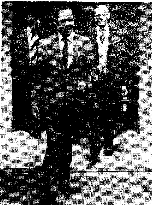
El presidente de la CIDH, doctor Andrés Aguilar, se retira del domicilio del doctor Arturo Frondizi, tras mantener una conversación de una hora con el ex presidente

A las 9.30 ingresó al local de la OEA una comisión de