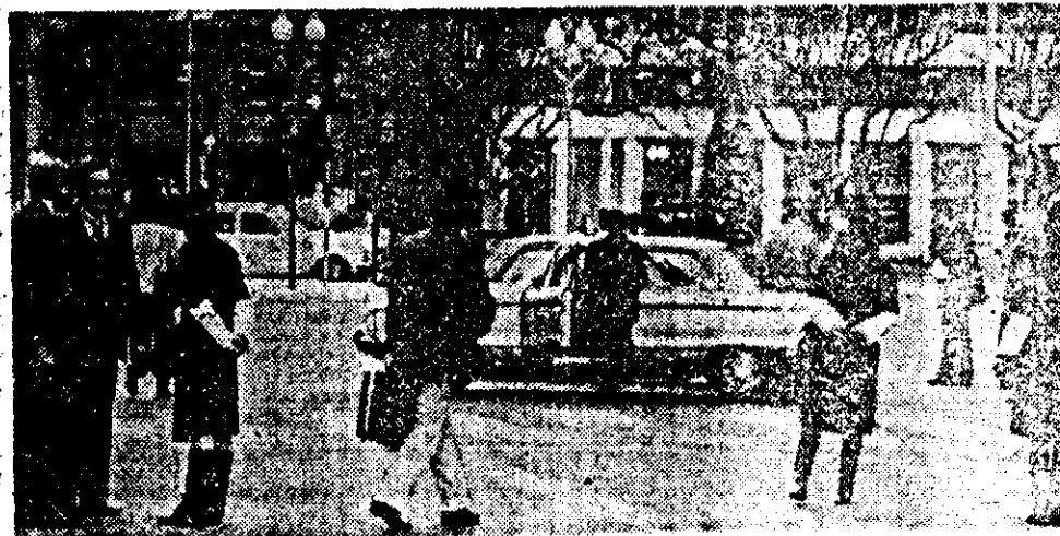
Rápida movilización policial hubo en Plaza de Mayo y sus contornos, luego de las explosiones. Toda la zona fue objeto de vigilancia por civiles y uniformados.

En ese momento llevaron más patrulleros y dos autobombas que se apostaron frente a la Casa de Gobierno, pero no llegaron a intervenir.