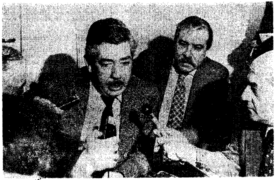
El secretario ejecutivo de la Comisión Interamericana de Derechos Humanos, doctor Edmundo Vargas Carreño, durante la reunión con los periodistas en el local de la OEA

Llega a su término la recepción de denuncias acerca de desapariciones