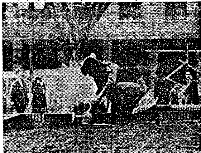
Un integrante de la Brigada de Explosivos de la Policía Federal mientras intenta desactivar uno de los artefactos explosivos colocados ayer en la plaza de Mayo

Se dispuso suspender el servicio del subterráneo de la línea "A" hasta la estación Lima, así como también el cierre del tránsito de toda clase de vehículos —salvo los policiales— por los alrededores