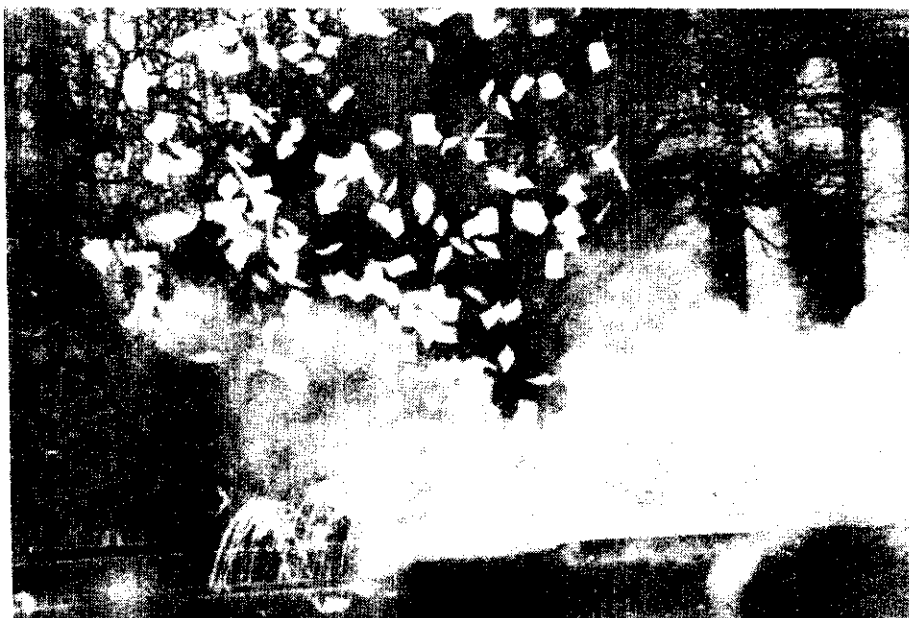
La nota gráfica registra el momento en que se produce el estallido de uno de los cinco artefactos lanzapanfletos hallados en la Plaza de Mayo en momentos en que se encontraban en el lugar familiares de presuntos desaparecidos.

"En ningún caso se produjeron víctimas ni daños materiales. Como medida de seguridad y para facilitar la labor de la Brigada de Explosivos fue necesario desalojar a las personas que circulaban por la Plaza de Mayo y desviar el tránsito de vehículos hacia calles adyacentes".