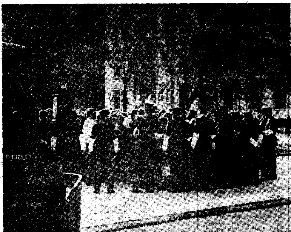
Fuerzas policiales solicitan a los familiares de los desaparecidos que se reunieron frente a la Casa de Gobierno que abandonen la Plaza de Mayo, ante la posibilidad de que hubiese más artefactos explosivos.

Cuando tres representantes de dicho grupo se hallaban en dependencias del Ministerio del Interior —a las 17.25— estalló el primero de los seis petardos lanzapañuelos que sembraron la Plaza de Mayo de volantes en que se reclamaba por los derechos humanos. Las autoridades policiales actuaron rápidamente, acordonando el área y recogiendo la mayor parte de los panfletos, que una hora después volvieron a ser distribuidos —esta vez a mano— en la calle Florida.