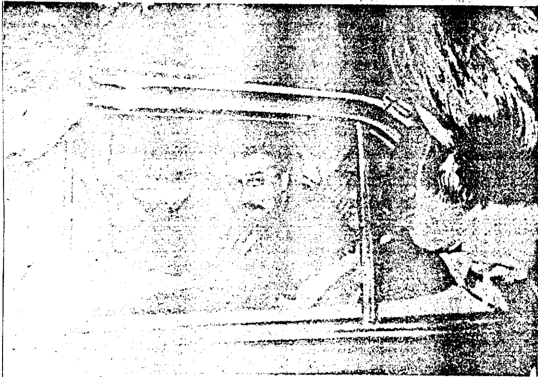
El embajador de México, en diálogo con el periodismo confirmó que el ex presidente Cámpora padece de cáncer.