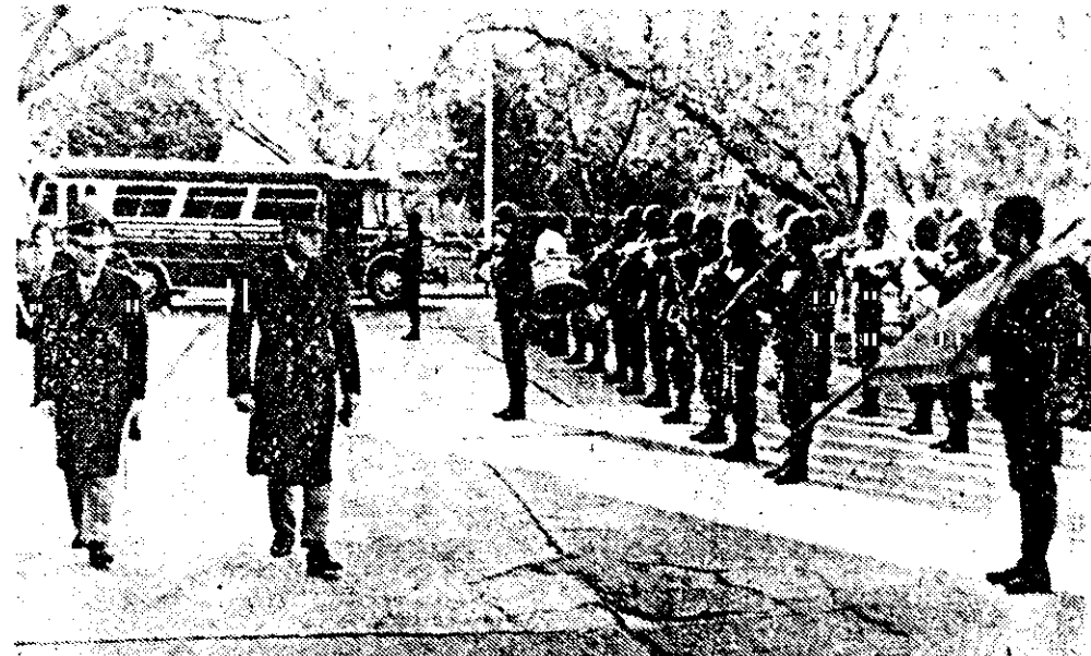
Los generales Menéndez y Lépori pasan revista a las tropas formadas frente a la sede del Comando de la VIII Brigada.