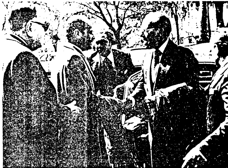
Andrés Aguilar y Tom Farer visitaron ayer la Corte Suprema de Justicia de la Nación. Allí fueron recibidos por funcionarios del Palacio de Justicia. Los integrantes de la Comisión Interamericana de Derechos Humanos siguieron así con su gestión en nuestro país.

Finalmente el general Menéndez al responder a preguntas periodísticas reiteró que la propuesta política será conocida este año y que también el sucesor del teniente general Videla será un militar en actividad o bien en retiro.