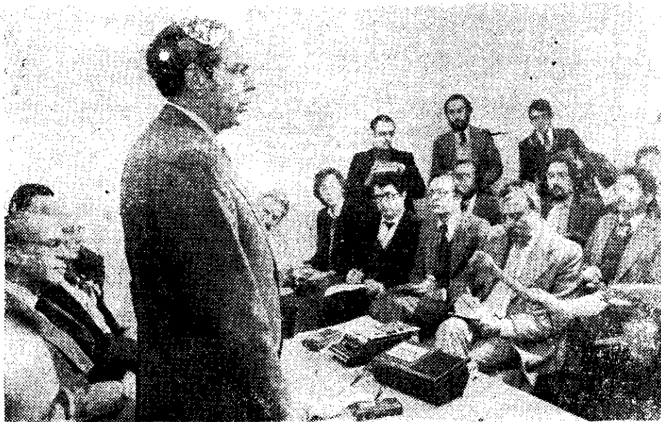
El presidente de la Comisión Interamericana de Derechos Humanos, doctor Andrés Aguilar, acompañado por los restantes miembros de ese organismo internacional, ofrece la última reunión informativa tras culminar su gestión en nuestro país.

La comisión desea dejar constancia de las facilidades que tuvo de parte del gobierno para el cumplimiento de su misión y agradecer la cooperación que le brindaron las autoridades, los medios de comunicación, las distintas instituciones representativas de la comunidad argentina y en general, el pueblo argentino.