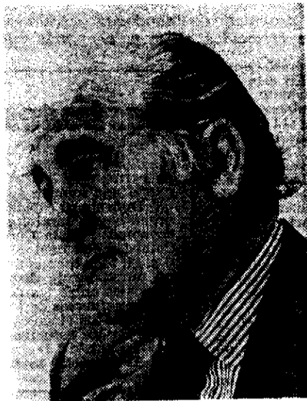
Alejandro Orfila, secretario general de la OEA.

3º) Fuentes diplomáticas de Bridgetown, capital de Barbados, confir-