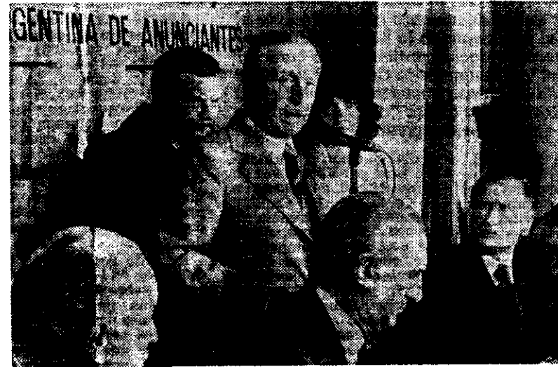
El comandante en jefe de la Fuerza Aérea, al hablar en la Cámara de Anunciantes.

"Aquí es donde radica, precisamente —enfaticó— la profunda relación que enlaza nuestras creencias religiosas con nuestros principios políticos. Porque, el concepto cristiano del amor al prójimo,